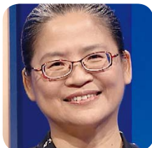
臺灣失智症協會 秘書長