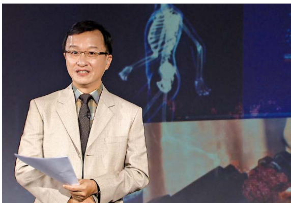
「認識巴金森」單元 主持人

什麼是有溫度的醫療？什麼是醫療之魂？ 醫療團隊除了在診間、在手術室、在病房搶救生命之外， 還能做些什麼？