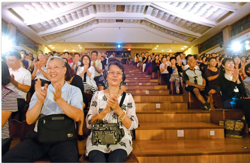
雙十國慶假期，民眾踴躍參加，講經堂及國議廳兩個會場幾乎滿座。演員由觀眾席各角落出現，再走上舞臺，將演出擴大到觀眾席。一個鐘頭的演出，觀眾陶醉在劇情中。