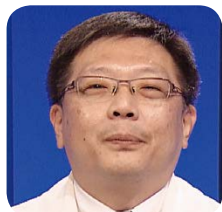
臺北慈院 心臟血管外科