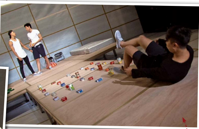
FOCA爾摩沙馬戲團，獲邀臺北藝術節活動中演出。圖為在劇場排練「一瞬之光」。