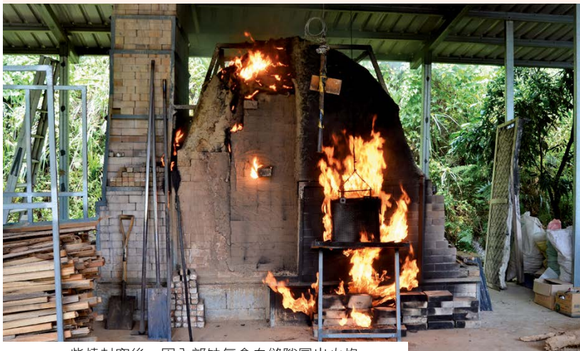
柴燒封窯後，因內部缺氧會自縫隙冒出火焰。

他熱情地示範手擠胚讓我們拍攝。大熱天裡不能開冷氣，也不能開電扇；因為風會加速黏土的乾燥速度，對創作的影響很大。