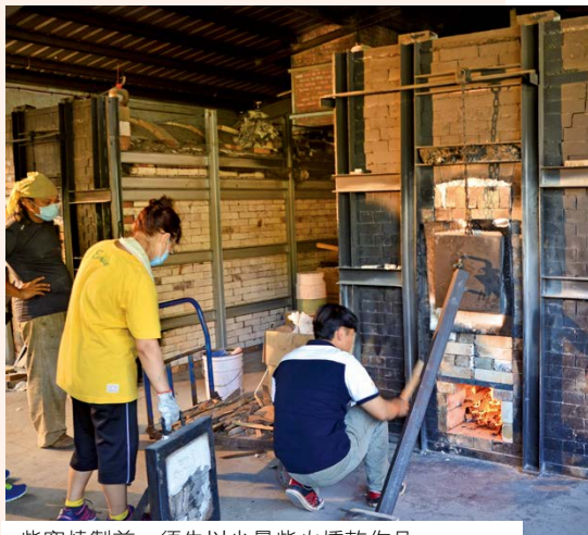
柴窯燒製前，須先以少量柴火燻乾作品。

只見他不斷地倒退轉，同時雙手使勁壓實黏土，相當費力，往往繞了一圈就滿頭大汗，必須停下來喘口氣再繞下一圈。沒多久，一隻渾圓討喜的陶豬便形塑了出來。